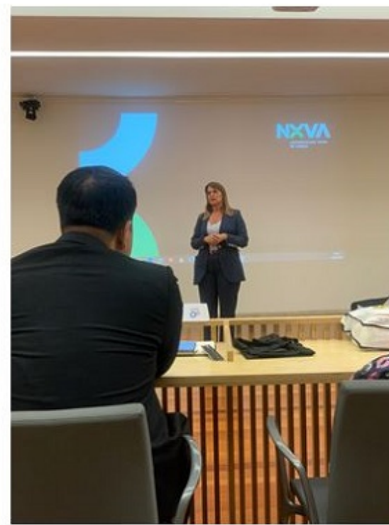
Ban điều phối dự án phía Châu Âu phát biểu khai mạc và giới thiệu về dự án

Tại phiên thứ 2, đại diện đến từ 5 trường Đại học tại Việt Nam lần lượt báo cáo kết quả khảo sát thị trường lao động trong các lĩnh vực của dự án. Trong đó, nhóm nghiên cứu khảo sát về lĩnh vực Công nghệ thông tin và Viễn thông được thực hiện bởi Trường Đại học Công nghiệp Hà Nội (phía Bắc) và Trường Đại học Nguyễn Tất Thành (phía Nam). Nhóm nghiên cứu khảo sát về lĩnh vực du lịch và khách sạn được thực hiện bởi Trường Đại học Hà Nội và Đại học Thái Nguyên. Học Viện Nông nghiệp Việt Nam phụ trách về lĩnh vực nông sản. Về tổng quan, các khảo sát được các Trường thực hiện dưới 3 hình thức: trực tiếp, qua email/điện thoại, Google form, tập trung chủ yếu vào các doanh nghiệp vừa và nhỏ. Các bộ tiêu chí được xây dựng trên cơ sở tham khảo bộ tiêu chí của các Trường Châu Âu khi triển khai dự án tương tự, có đưa vào đặc thù ngành/lĩnh vực và của Việt Nam.