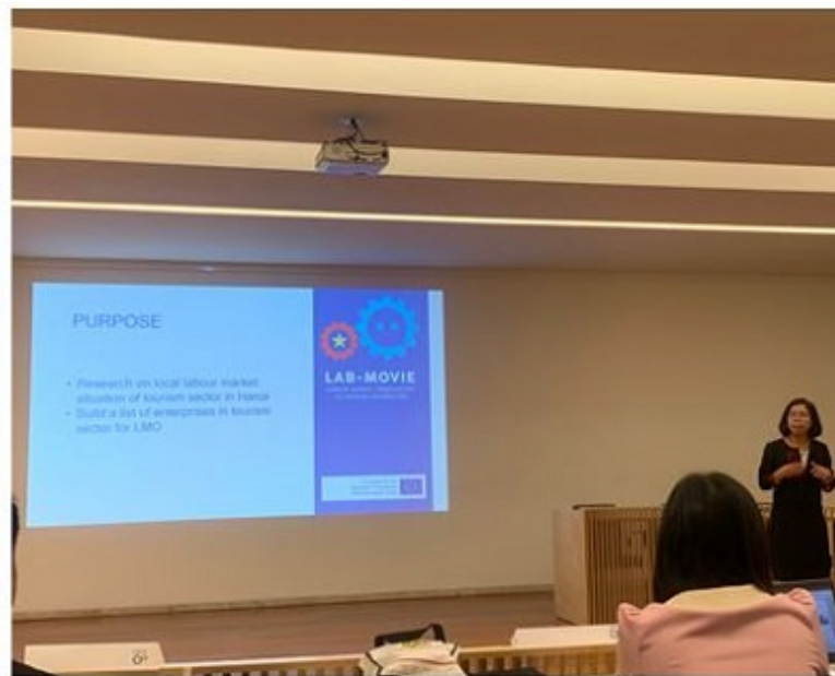
Nhóm nghiên cứu lĩnh vực khách sạn và du lịch báo cáo kết quả