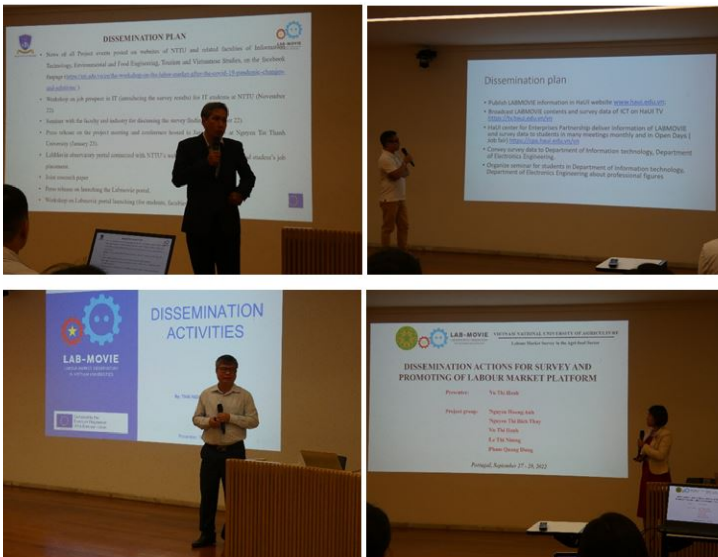
Các nhóm nghiên cứu báo cáo về kế hoạch phổ biến và truyền thông kết quả của dự án

Hội thảo và tập huấn đã thành công tốt đẹp với sự tổ chức và chuẩn bị chu đáo, nhiệt tình từ Đại học NOVA LISBON. Các trường đại học phía Việt Nam sẽ hoàn thiện nốt gói công việc số 2 (WP2) và chuẩn bị cho việc xây dựng nền tảng quan sát thị trường lao động (LMO) trong thời gian tới. Các hoạt động dự kiến tiếp theo của dự án sẽ bao gồm các buổi Tập huấn, Hội thảo liên quan đến các nội dung xây dựng website của từng đối tác phục vụ triển khai kết quả dự án, phổ biến các kết quả dự án, tổng kết dự án.