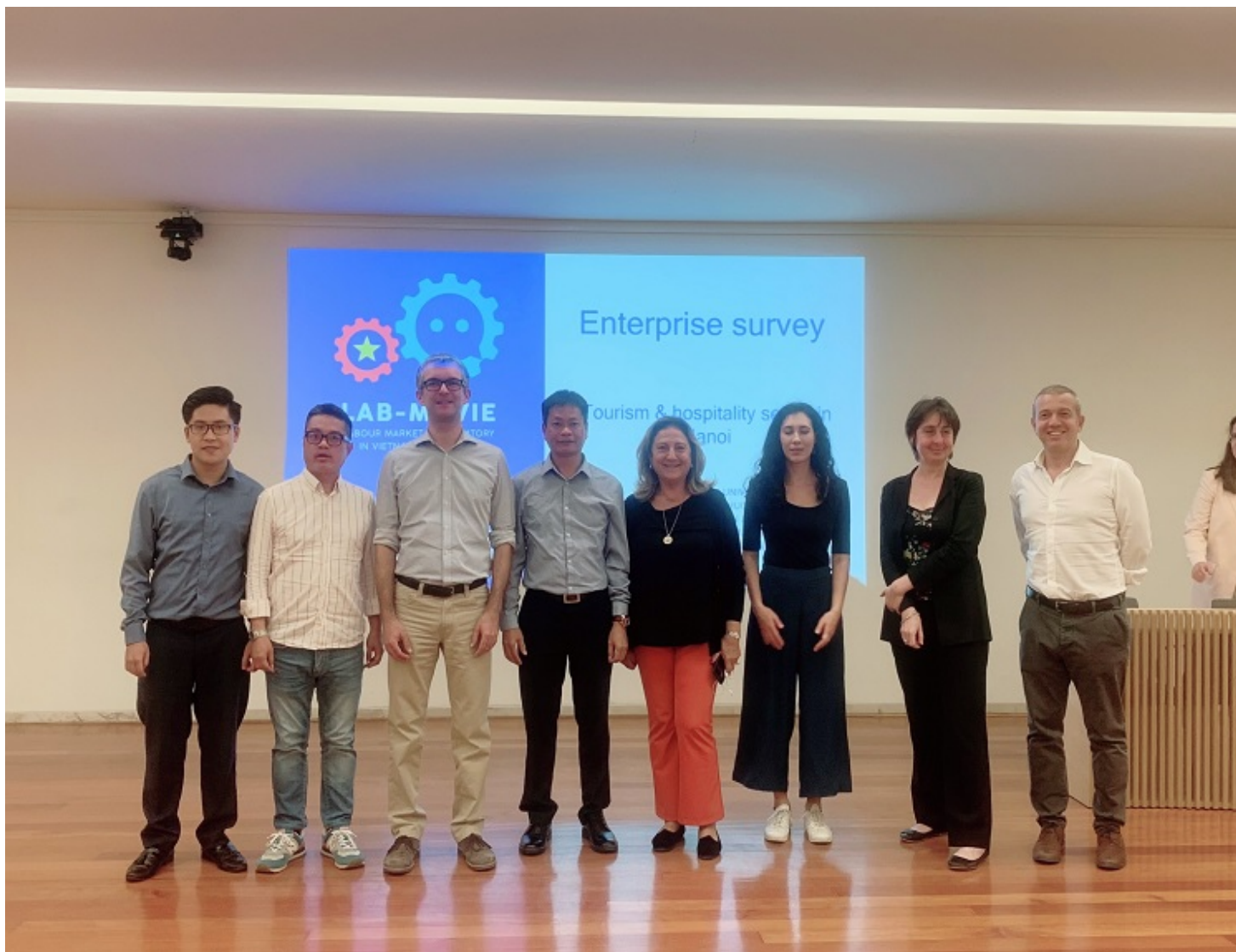
Nhóm nghiên cứu HaUI chụp ảnh lưu niệm với Ban điều phối phía Châu Âu